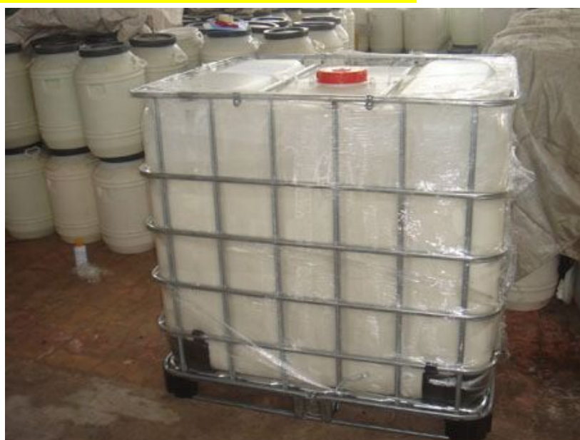
液体空运快递的金属框架，可以保护又可以当托盘，也方便运输。