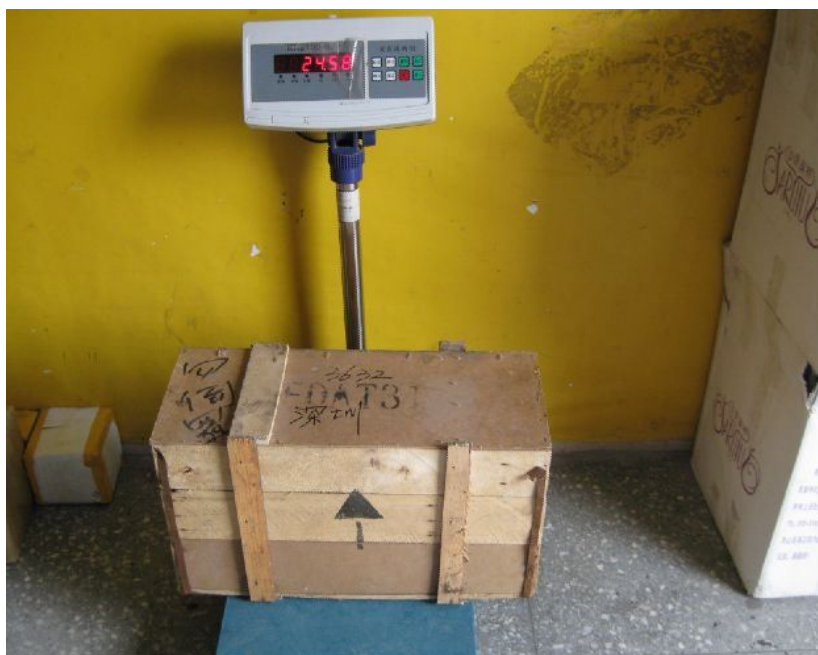
液体空运快递的一般小件用木箱，防止挤压和碰撞